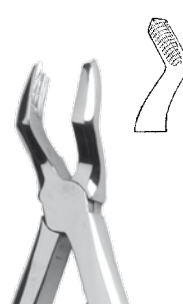
OK-Molaren Upper Molars

3B Rautengriff/ rhomb profile REF 11834 Anatomisch/ anatomic REF 118834