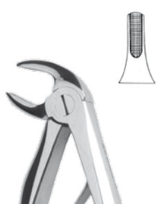
UK-Wurzeln Lower Roots

7B Rautengriff/ rhomb profile REF 11831 Anatomisch/ anatomic REF 118831