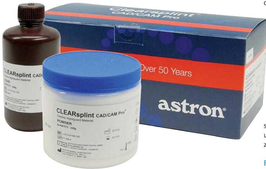
Abb. 5: CLEARsplint® CAD/CAM Pro.

franke Ränder oder Kunststoffwülste, sind darauf zurückzuführen, dass der Kunststoff entweder zu früh, in einem falschen Mischungsverhältnis oder bei falscher Einstellung des Drucktopfs ausgehärtet wurde. Ein weiteres Indiz sind verklebte oder gar abgebrochene Fräser während des Fräsvorgangs.